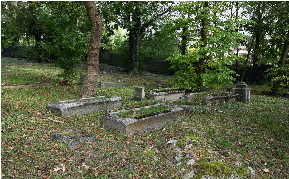
Cmentarz ewangelicki w Sicienku

średniowieczna wsi, rozwój w XIX w. jako majątku ziemskiego oraz neoklasycystyczna forma dworu przypisywana pracowni Wiktora Stabrowskiego.