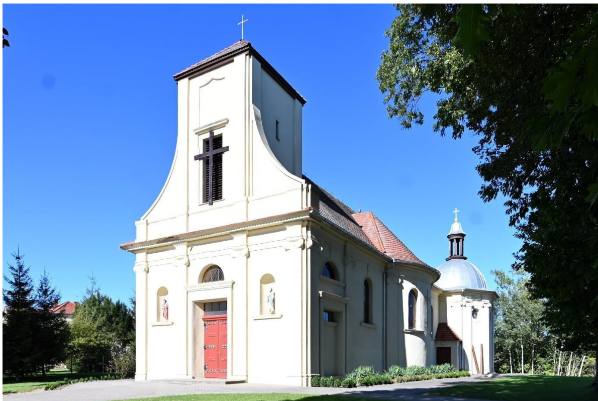
Kościół pw. Najświętszego Serca Pana Jezusa w Samsiecznie