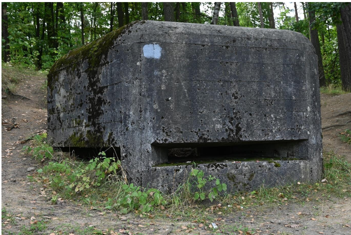
Kruszyn, Schron nr 5

Ważnym elementem zachowanego dziedzictwa są schrony bojowe i relikty umocnień z 1939 r. Tworzą one specyficzną kategorię zabytków nieruchomych o charakterze militarnym. Na terenie gminy zinwentaryzowano łącznie 20 obiektów powiązanych z systemem Przedmościa Bydgoskiego i Linią Jezior Koronowskich. Usytuowane w kluczowych punktach obserwacyjnych, stanowią materialne świadectwo przygotowań obronnych II Rzeczypospolitej oraz dramatycznych wydarzeń kampanii wrześniowej. Współcześnie włączane są w sieć szlaków turystyki historycznej, jednak część z nich ulega postępującej degradacji (zawilgocenie, zarośnięcie, zanieczyszczenie), co wymaga połączenia działań porządkowych, zabezpieczających i interpretacyjnych (tablice, ścieżki dydaktyczne) z poszanowaniem ich autentyczności.