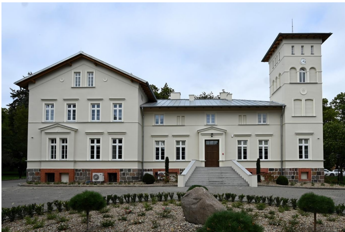
Dwór w Wojnowie